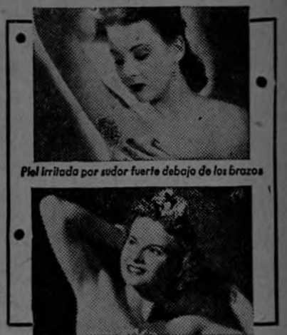
Piel irritada por sudor fuerte debajo de los brazos

dos con su profesión. Deseamos al culto matrimonio Chartier-Patterson muy feliz viaje: dados los vastos conocimientos del Dr. Chartier y la dedicación a su profesión, le auguramos un gran éxito en los estudios a que dedicará su tiempo en Estados Unidos.